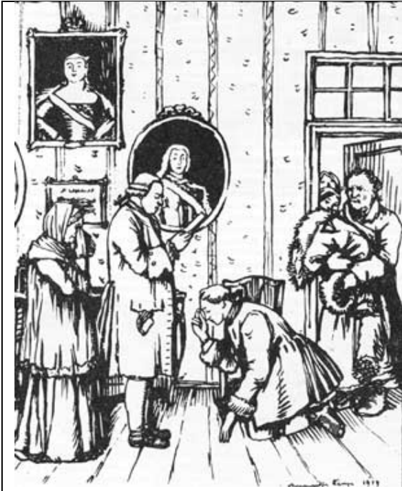
А. Бенуа, 1919