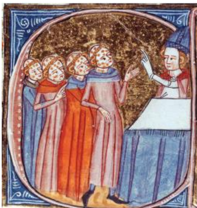
Священник благословляет больных бубонной чумой. Средневековый манускрипт

3. Чума убила множество людей. Едва ли десятая часть населения выжила. Было также замечено, что все рождённые после чумы имели вдвое меньше зубов, чем люди имели до. Следующий год, 1350, был годом, посвящённым пресмыкающимся. Но удивительно, как быстро люди забывают Божий гнев. По грехам людским, или так верили, Господь позволил человечеству быть уничтоженным настолько, чтобы выживших едва хватало, чтобы хоронить мёртвых. Но люди так и не отказались от своих ужасных преступлений.