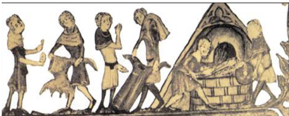
Крестьяне сжигают одежду заражённых чумой. Средневековый манускрипт