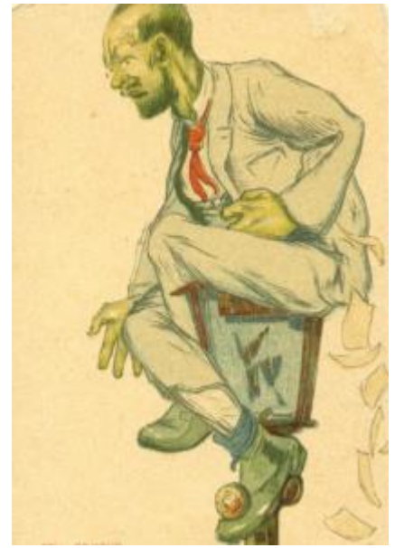
Социал-демократическая партия (РСДРП)

Задание 9. Когда столичный город Санкт-Петербург был переименован в Петроград?