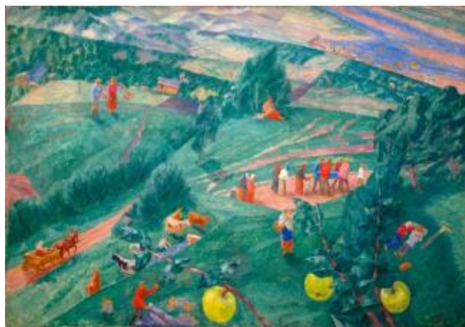
1. Кузьма Петров-Водкин. Полдень. Лето. 1917

Задание 21. Какие из представленных живописных произведений можно сопоставить с приведенным фрагментом текста?