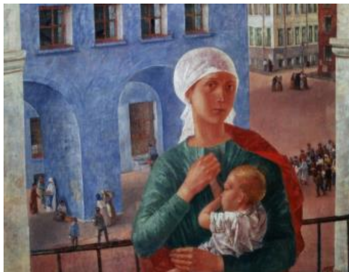
1. К. Петров-Водкин; Петроград

Задание 25-27. Какой город изображен на этой картине? Запишите название города.