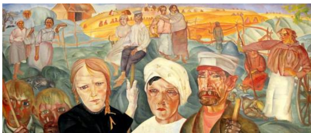
4. Борис Григорьев. Земля крестьянская. 1917

Ответ: 2. Борис Кустодиев. Лето (Поездка в Терем). Фрагмент. 1918