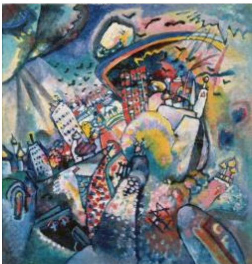
2. В. Кандинский