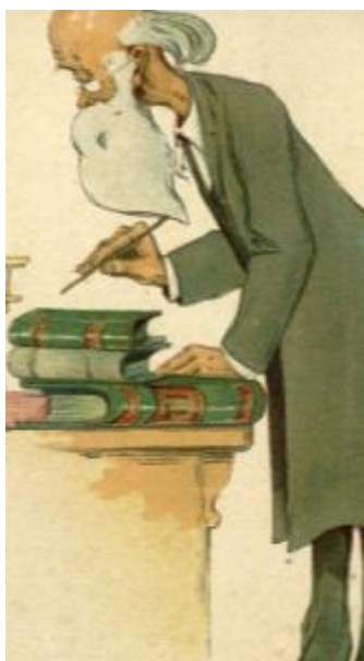
Конституционно- демократическая партия (кадеты)