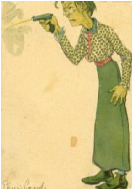
Партия социалистов-революционеров (эсеры)