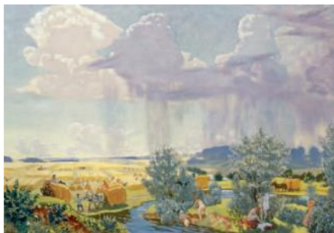
2. Борис Кустодиев. Лето (Поездка в Терем). Фрагмент. 1918