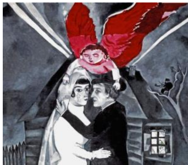
3. М. Шагал; Витебск