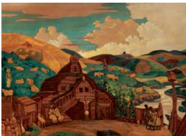
3. Николай Рерих. Три радости. 1916