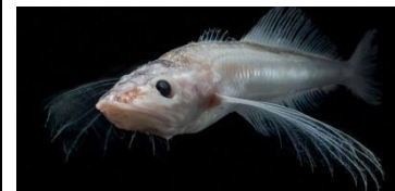
5. Comephorus baikalensis