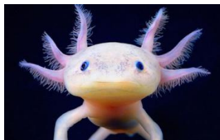
4. Ambystoma mexicanum