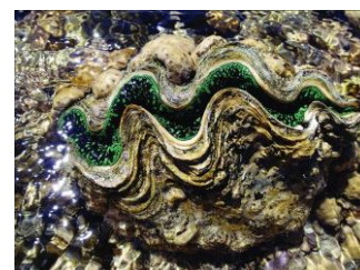
5. Tridacna gigas