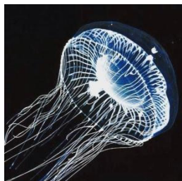
3. Aequorea victoria