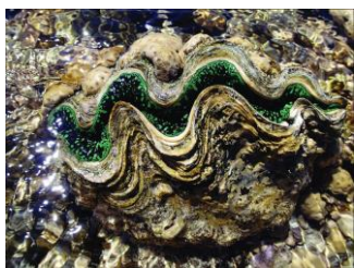
1. Tridacna gigas