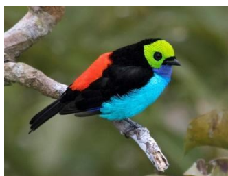
2. Tangara chilensis