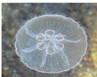
3. Aurelia aurita