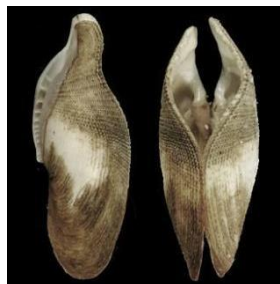
2. Pholas dactylus