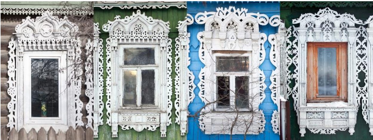
Рис. 2. Образцы наличников пос. Гжель, Московская область

Габаритные размеры изделия в сборе: 140×200 мм. Предельные отклонения размеров ± 1 мм.