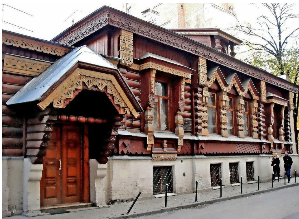
Рис. 1. Дом А.А. Пороховщикова в Староконюшенном переулке, Москва

Домовая резьба характерна для русской деревни. Функция домовой резьбы не только в украшении и декорировании богатым убранством дома, но и в защите от внешних воздействий стыков оконной рамы со срубом, сруба дома с фронтоном и т.д. В настоящее время в части регионов она не только сохранена, являясь визитной карточкой многих деревень, сёл и даже городов, но и бережно размещается в музеях деревянного зодчества. Например, в Москве, прогуливаясь по Староконюшенному переулку, рядом с Арбатом, вы можете познакомиться с домом Александра Александровича Пороховщикова (Рис. 1), предпринимателя, строителя, публициста, мецената, и общественного деятеля. Дом с резными украсами был выстроен в 1872 г. Проект дома получил в 1873-м году премию на Всемирной выставке в Вене (Австрия).